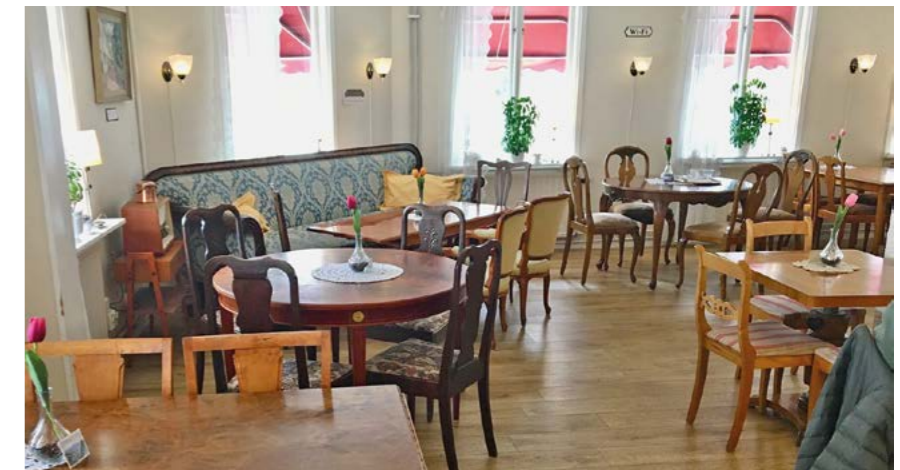
Kaféet vittnar om en kafémiljö med äkta hemkänsla.

Med sina second handmöbler finner sig en kafémiljö med äkta hemkänsla. Något som många kunder också vittnar om.