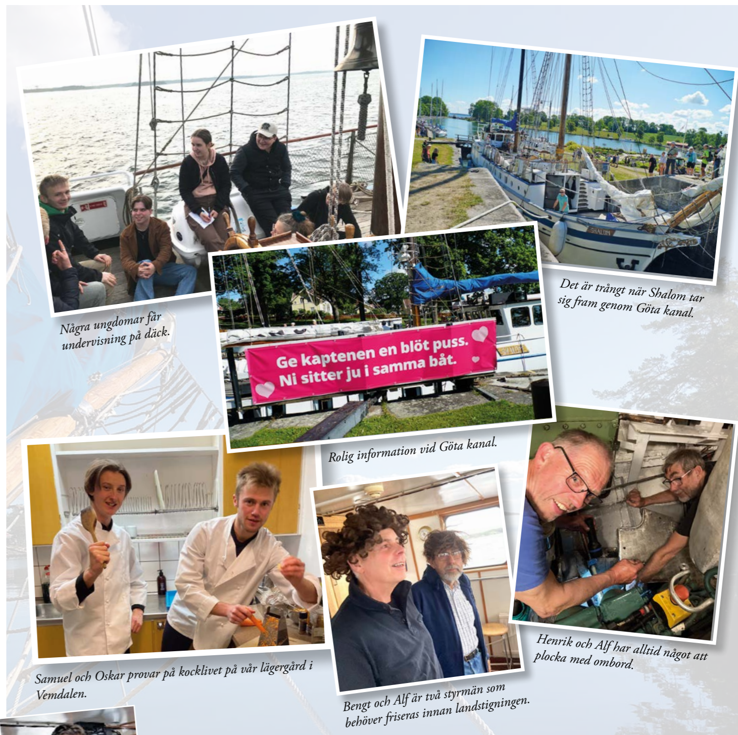
Några ungdomar får undervisning på däck.