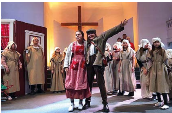
Fröken Andersson och lottförsäljaren fick resa bakåt i tiden för att leta reda på stjärnans betydelse.

Det blev succé när Shaloms nyskrivna julmusikal "En stjärna född" sattes upp i Hamnkyrkan i Oskarshamn julen 2022.