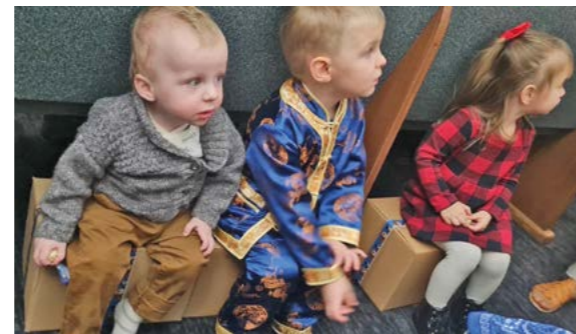
Barnen drabbas hårt av kriget.

Jag fick ett samtal från en av våra kontakter i Rivne. Jag frågade hur det var och han sa att "Det är tufft att dag efter dag leva under krigets vingar, men vi känner hur Jesus beskyddar och går vid vår sida, och att ni finns med och hjälper, ger oss hopp och en strimma med glädje mitt i allt elände. Vi kan tack vare er hjälpa så många människor, och tillsammans kan vi rädda liv, vi kan ge barn och föräldrar mat och en flaska vatten så de kan stilla hunger och törst, vi kan ge människor på flykt en sovplats, en vinterjacka att värma sig med i kylan. På detta sätt kan vi också nå ut med evangeliet och berätta om Jesus och många söker sig till honom i denna svåra tid. Kyrkorna är fullsat-