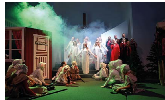
Herdar fick besök av en änglakör.