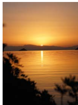
Utsikten från Porto Astro där de grekiska missionsbåtarna finns.