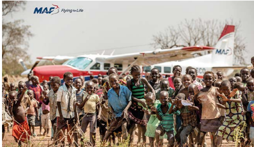
Barnen i flyktinglägret i norra Uganda dras direkt till planen när MAF landat. För de flesta är MAF-planet det första plan de får se på nära håll.

För de människor som lever i svårtillgängliga områden kan tillgång till flyg vara helt livsavgörande.