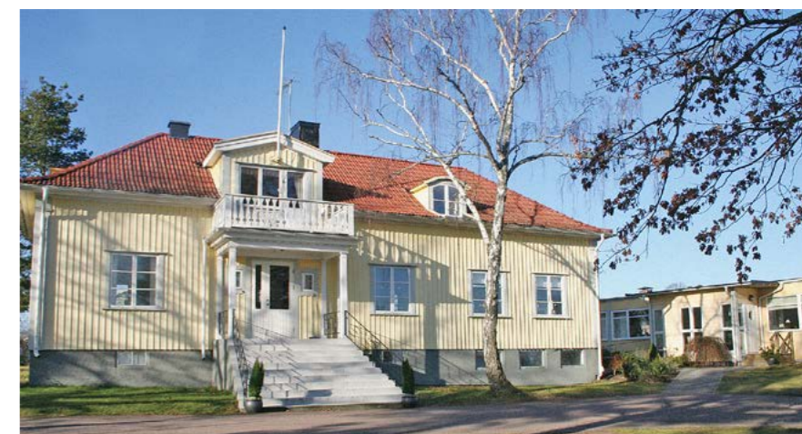
Villa Shalom - med havet och naturen inpå knuten.

även hyra Villan för större sällskap eller om man vill arrangera ett läger. Lena Bock är ansvarig för Villa Shalom och tillsammans med Hussain Husseini tar dem emot våra besökare och gäster.