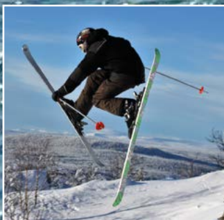
Fjällresa Vemdalen sid 3