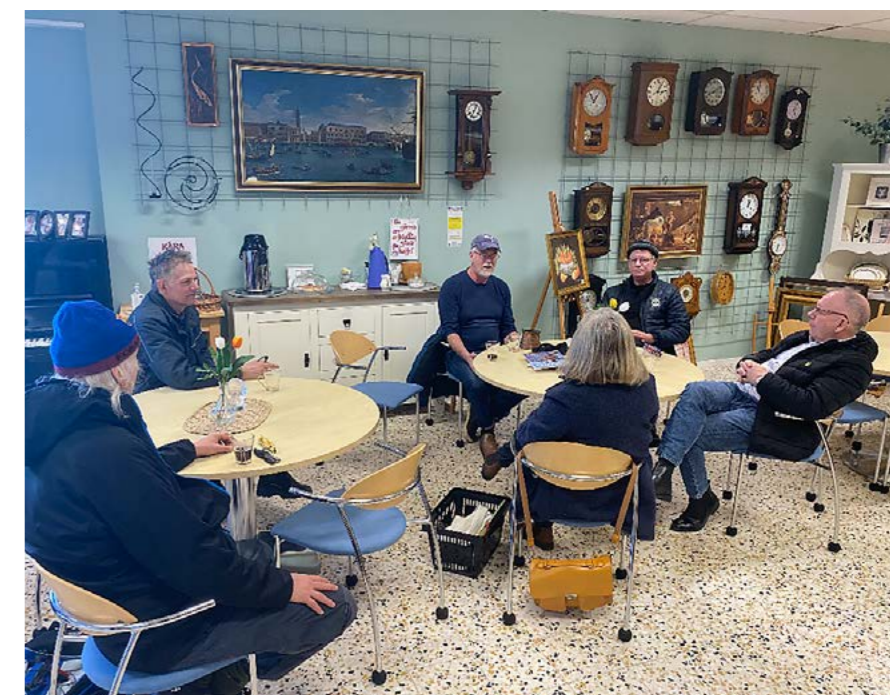
Samtal i fikahörnan på Shalom Second Hand i Mönsterås.