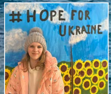
Ukraina - ett rop på hjälp sid 4