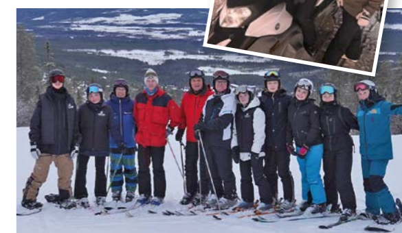
Teambibelskolan på fjällresa under några veckor.

Det finns 63 stycken fasta bäddar. Det finns även ett stort samlingsrum, bordtennis, storkök, matsal, dusch och bastu. Vår strävan med lägergården är att kunna erbjuda en positiv och glädjefylld upplevelse av Guds fina skapelse.