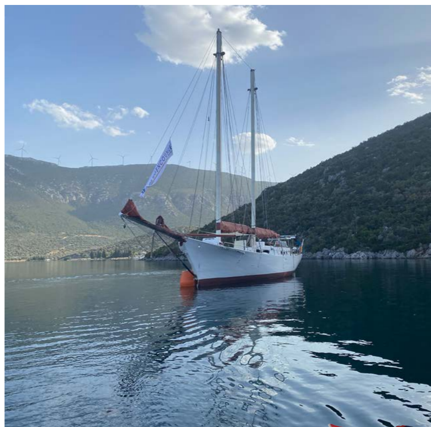
En ny missionsbåt vid namn Encounter finns i Grekland.

Vi rustar båten för ytterligare en sommar och ser fram emot att få seg-