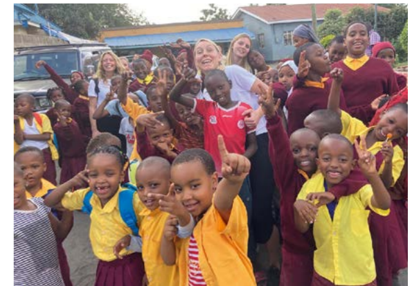
Besök på en skola.