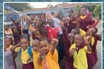
Missionsresa till Tanzania sid 13