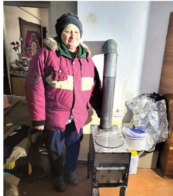
En kvinna som fått del av vår hjälp i Ukraina.

med på ett eller annat vis, detta är något vi gör tillsammans med församlingar, företag, privatpersoner, andra organisationer. Och under året som kriget pågått så har vi haft ett fint samarbete med Shalom som har stöttat upp och samlat in förnödenheter och ekonomi som de drabbade i Ukraina har stort behov av. Jag berörs verkligen gång på gång över engagemanget, och att vi alla enas och gör detta tillsammans